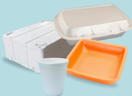
Emballages en mousse