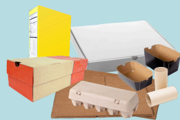
Carton pour boîtes et boîtes en carton