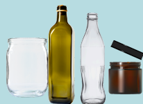
Contenants en verre