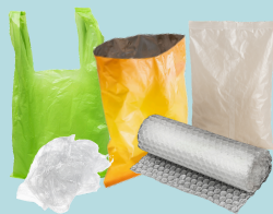
Emballages en plastique flexible