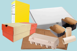
Cardboard and boxboard