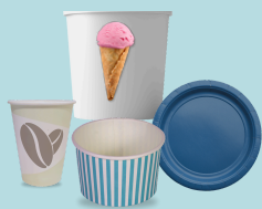
Emballages en papier laminé