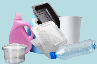
Contenants en plastique