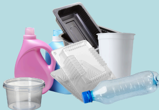
Contenants en plastiques