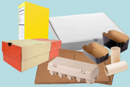
Cardboard and boxboard